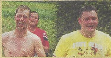
Mit Spaß dabei.

Dusch- und Umkleidemöglichkeiten finden die Sportler in der Alemannenhalle. Auswärtige Besucher sind herzlich willkommen. Auch für die Bewirtung ist gesorgt: Die Läufer werden selbstverständlich kostenlos an der Strecke und im Zielbereich mit Wasser, isotonischen Getränken, alkoholfreiem Bier versorgt. Für Zuschauer und Läufer gibt es auf dem Schulhof der Lilly-Jordans-Grundschule ein reichhaltiges Speisenangebot: So werden zum Beispiel ab 13 Uhr leckere Nudelgerichte mit verschiedenen Soßen unter dem Namen Fair Penne angeboten. Außerdem gibt es Kaffee und Kuchen, sowie einige Säfte und Weine aus dem Sortiment des „Eine-Welt-Ladens“.