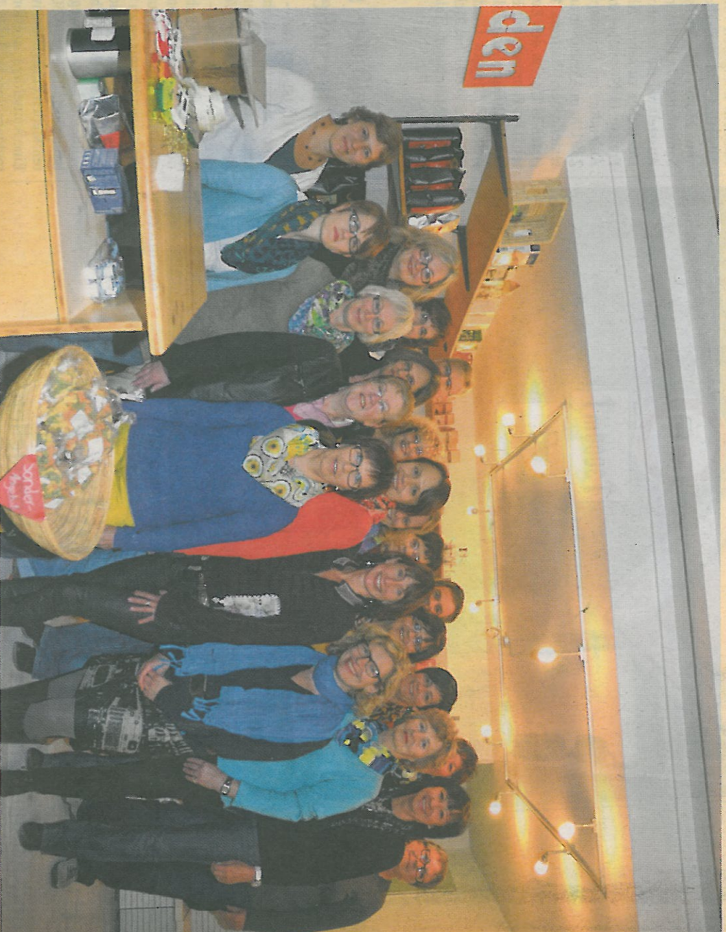
Das Team der Aktion Eine Welt freut sich über die Neueröffnung in neuen Räumen.